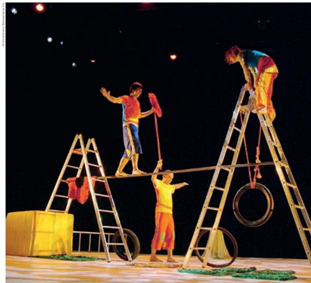
► CENA DO ESPETÁCULO O TAL DO QUINTAL – BRINCADEIRAS, MEDOS E SONHOS , DA BALANGANDANÇA CIA., SÃO PAULO, SÃO PAULO, 2006.

OBSERVE NESTA OUTRA IMAGEM OS OBJETOS E OS GESTOS DOS BAILARINOS.